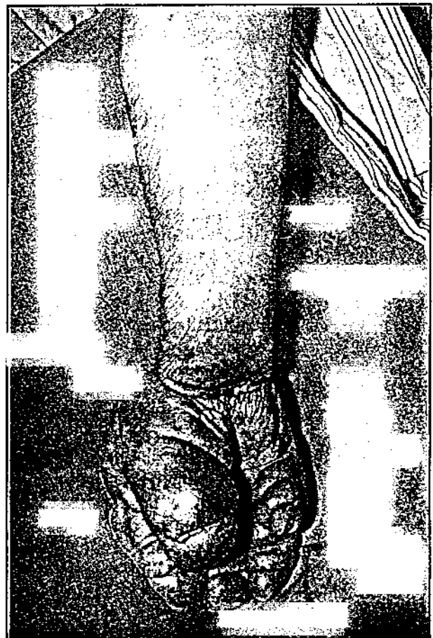
Fig. 2 Paralysie post-radique avec éléphantiasis de la main.

— Le quatrième stade est caractérisé par une atteinte motrice majeure avec impotence complète du membre supérieur. A ce stade, l'état neurologique aggrave considérablement le pronostic du lymphœdème qui ne peut plus bénéficier de la mobilisation active, adjuvant majeur du drainage lymphatique. L'évolution vers l'augmentation progressive du lymphœdème est inéluctable, aggravant l'impotence en un cercle vicieux, et aboutissant à un éléphantiasis d'un membre supérieur