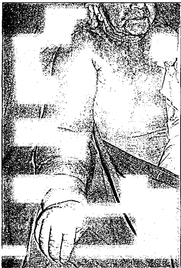
Fig. 1 Volumineux lymphœdème 5 ans après intervention de Halsted suivie de cobaltothérapie.

d'autant: plus grands que les champs irradiés ont été plus vastes : champ sus-claviculaire, chaîne mammaire interne ; les complications lymphatiques sont d'autant plus importantes que la patiente présentait une tumeur mammaire volumineuse avec adénopathie.