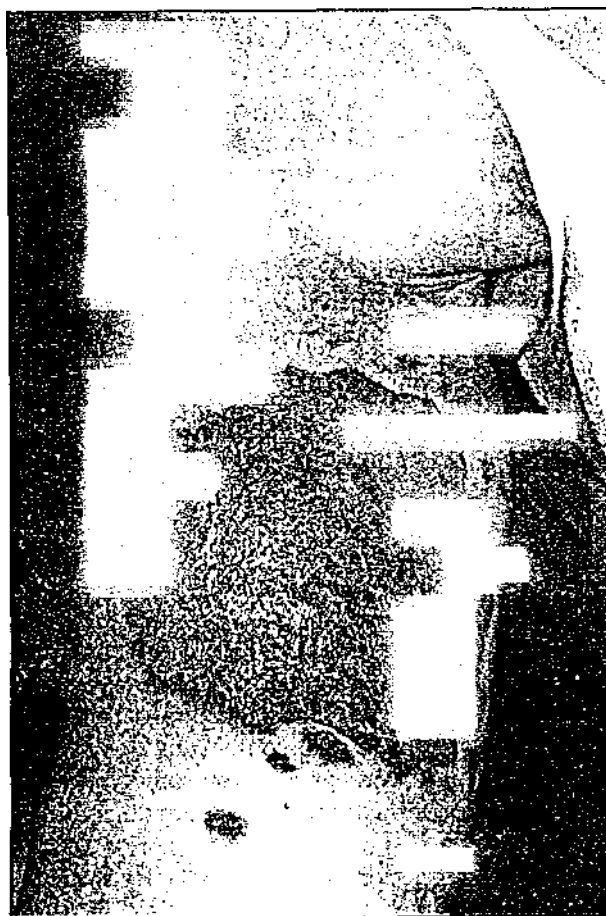
Fig. 3 Angiosarcome de Stewari-Treves,

Les lymphangectomies consistent à faire l'exérèse de tous les tissus cellulaires sous-cutanés < gorgés de lymphœdème > et de l'aponévrose, puis à appliquer la peau sur les masses musculaires soit en plastique de recouvrement, soit en greffe cutanée. La réduction morphologique du lymphœdème est ainsi obtenue, mais au prix de nécroses cutanées, d'une cicatrisation lente, et souvent de plusieurs temps chirurgicaux, avec un résultat insuffisant au niveau de la main, inesthétique au niveau du reste du membre supérieur. Surtout, le patient n'est pas mis à l'abri d'accès lymphangitiques qui peuvent se compliquer de septicémie.